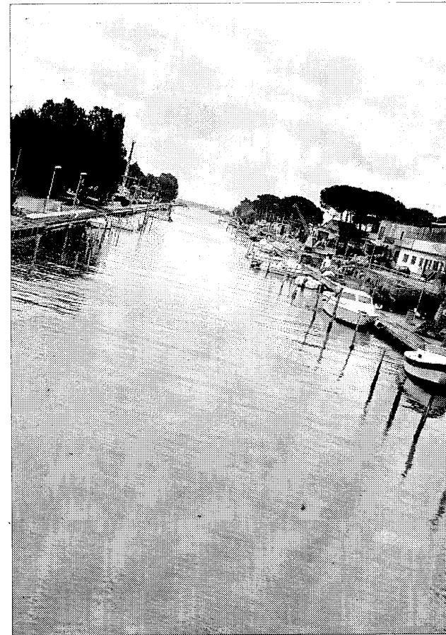
Il porto di Terracina e Focce Sisto